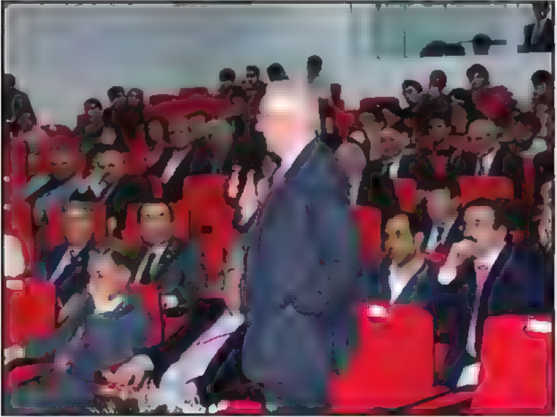
Konferans Yoğun Tartışmalarla Geçti